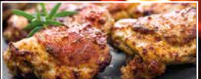
Bio-Hähnchenkeulen-Steaks mariniert 3805 - 600 g = € 24,16 (Seite 22)