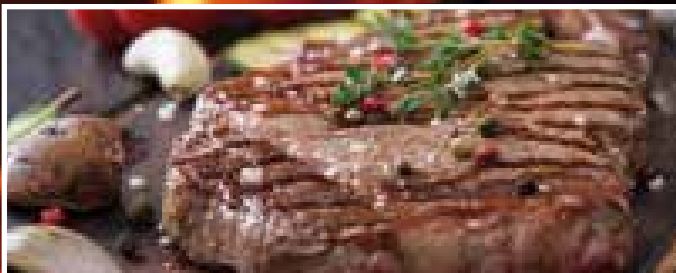
4 x Bio-Entrecôte mariniert 3210 - 800 g = € 55,32 (Seite 31)