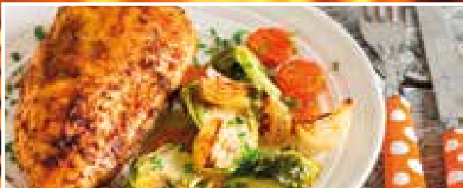
4 x Bio-Hähnchenbrust mariniert 3200 - 600 g = € 34,65 (Seite 23)