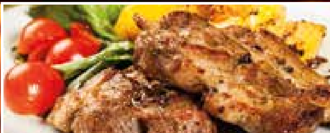
4 x Bio-Schweinenackensteaks mariniert 3220 - 720 g = € 28,62 (Seite 38)