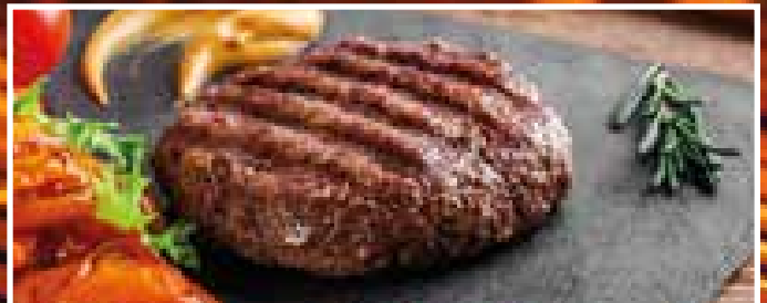
8 x Bio-Hamburger 3000 - 640 g = € 20,29 (Seite 35)